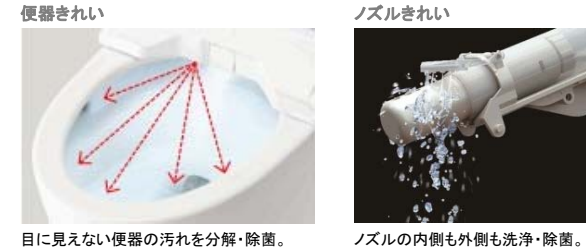
便器きれい ノズルきれい 目に見えない便器の汚れを分解・除菌。 ノズルの内側も外側も洗浄・除菌。

TOTO独自の「きれい除菌水」が、見えない汚れを分解・除菌。汚れをもとからきれいにします。