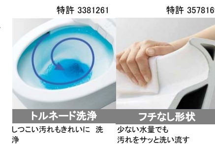
トルネード洗浄 フチなし形状 しつこい汚れもきれいに洗 少ない水量でも汚れをサッと洗い流す