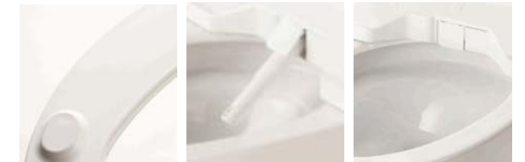
クリーン便座 クリーンノズル クリーンケース 特許 5459514 クリーン便座・クリーンノズル

便座・ノズル・ケースの素材に防汚効果の高い樹脂を採用。さっとひとふきでお手入れ完了。